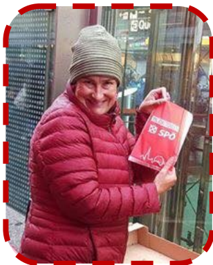
...10.000 Kipferln verteilt...