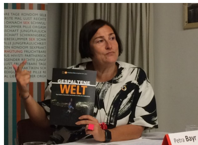
Bei der Präsentation des Berichtes

Bildung für alle sowie Zugang zu kostenlosen Verhütungsmitteln und den gleichen Bildungsmöglichkeiten für Mädchen könnte Abhilfe schaffen. Bildung ist ein Menschenrecht und auch im Zusammenhang mit der Selbstbestimmung über den eigenen Körper ein Schlüsselfaktor. Ich bin der Meinung, Zugang zu Bildung darf nie davon abhängen, ob man arm oder reich ist.