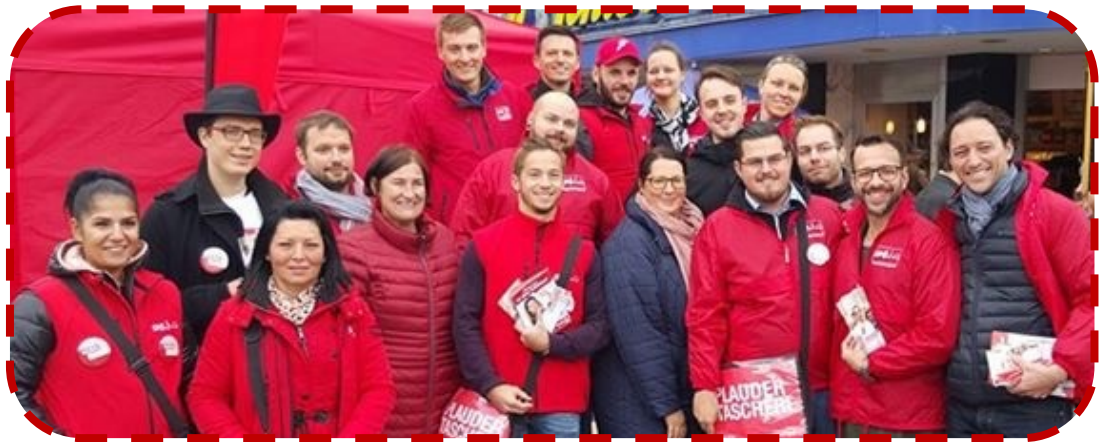
...9332 persönliche Kontakte während des Wahlkampfes...