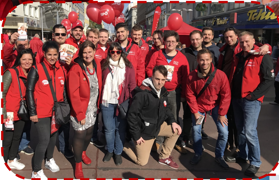
...so viele kämpferische MitstreiterInnen!!!