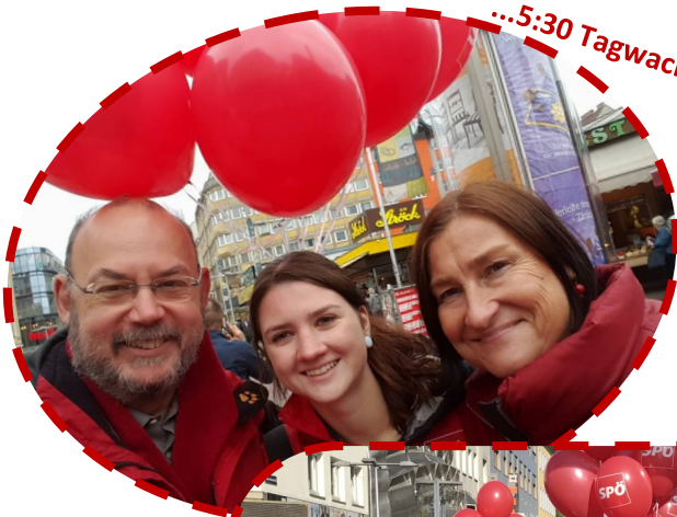
...5:30 Tagwache als Normalzustand...