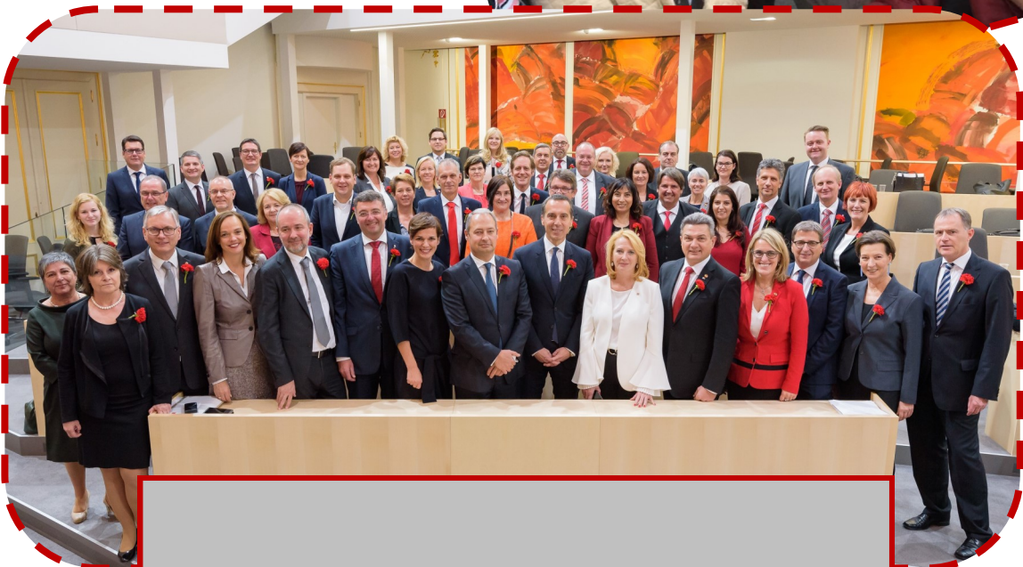
Geschafft: Am Tag der Angelobung!