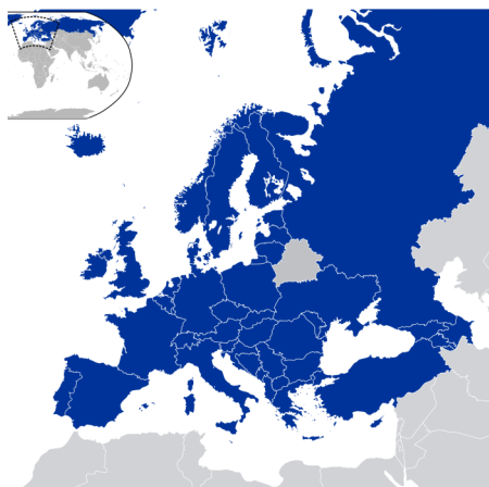
Mitgliedstaaten des ER

Der Europarat (ER) ist eine internationale Organisation mit eigener Rechtspersönlichkeit. Sein Sitz befindet sich in Straßburg. Der ER wurde am 5. Mai 1949 von zehn europäischen Staaten gegründet, wobei sich bis zum Ende des Kalten Krieges die Mitgliederzahl auf 23 erhöhte. Seine Gründung verfolgte das Ziel, nach dem Zweiten Weltkrieg einen langanhaltenden Frieden zu schaffen und zu sichern.