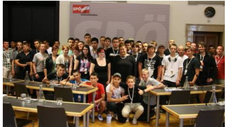
Nicht auf den Mund gefallen: Die nächste Generation der MaschinenbauerInnen und ElektronikerInnen bei den ÖBB

Beim abschließenden Gespräch im SPÖ-Parlamentsklub drehte ich den Spieß dann um und fragte sie, was sie denn nun anders machen würden? Eine ziemlich wilde Diskussion entbrannte und am Ende waren wir uns darüber einig, dass Nörgeln alleine zu wenig ist, und, dass wer etwas verändern möchte, nicht drum herumkommt sich auch politisch zu engagieren.