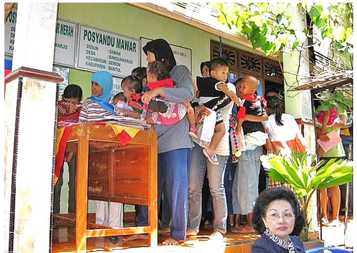
Zu Gast in Frauengesundheitszentrum in Yogyakarta: Die neue „Two Kids are Better!“-Kampagne trägt bereits Früchte.

Quelle: UNFPA, "The state of world population 2011"2 & PRB, "2010, World Population Datasheet"