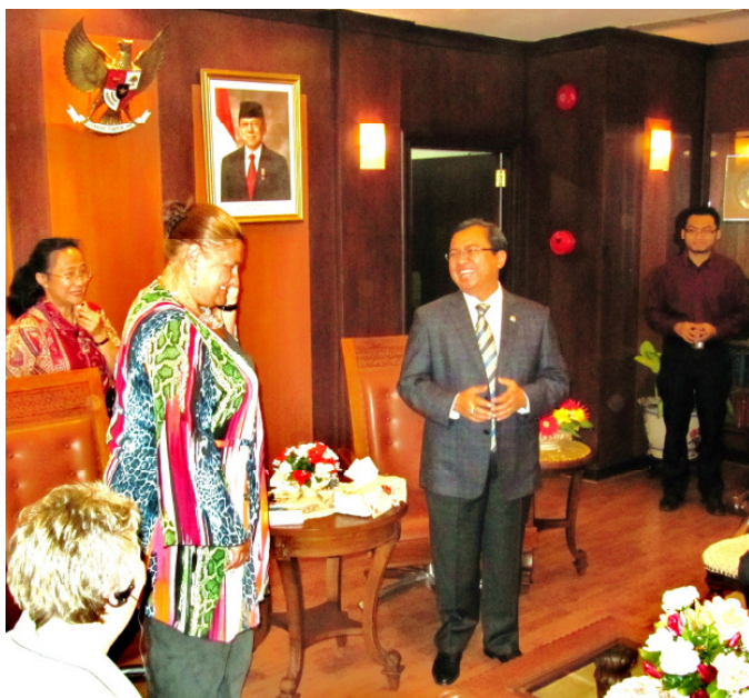
Zu Gast im indonesischen Parlament

Im Rahmen einer Studienreise mit dem EPF (Europäischen Parlamentarischen Forum für Bevölkerung und Entwicklung) leitete ich im August eine Delegation von fünf europäischen Abgeordneten in Indonesien, wo wir Einrichtungen zur Förderung von selbstbestimmter Familienplanung und Bevölkerungsentwicklung besuchten. Dabei hatten wir sowohl die Möglichkeit in den unterschiedlichen Einrichtungen mit Fachpersonal und KlientInnen zu reden, als auch unsere Eindrücke mit den zuständigen PolitikerInnen zu besprechen.