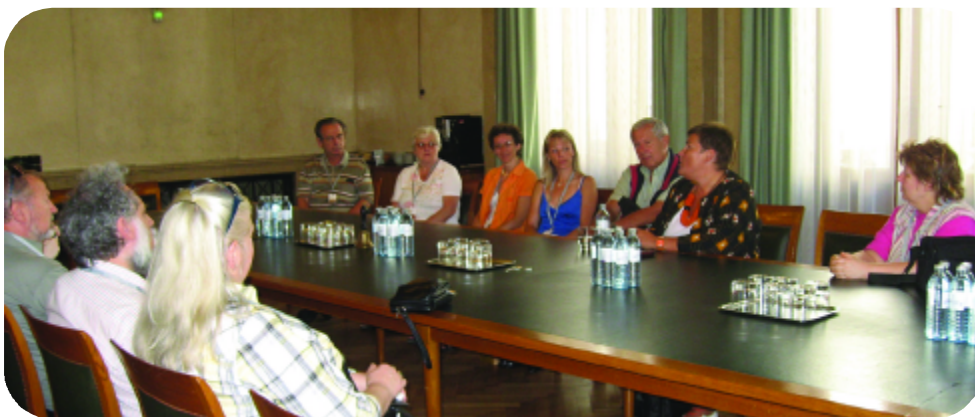
FavoritnerInnen auf Besuch bei mir im Parlament am 17. Juni

Wie schon in der letzten Ausgabe angekündigt, gab es Mitte Juni bei den zwei Plenarsitzungen des Nationalrats wieder Gelegenheit, dem Parlament einen Besuch abzustatten.