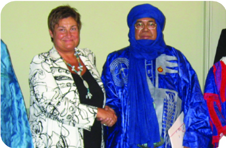
Petra Bayr dankt dem Parlaments-Vizepräsidenten von Mali für seine Hilfe bei der Geiselnbefreiung

Den Besuch einer hochrangigen Delegation aus dem afrikanischen Mali im österreichischen Parlament nutzte ich im Mai, um dem Vizepräsidenten des malischen Parlaments, Assarid Ag Imbarcaouane zu danken, dass er sich so erfolgreich für die Befreiung der österreichischen Geiseln im letzten Jahr eingesetzt hatte.