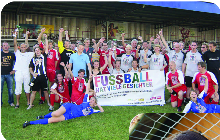
Sportclub-Platz: beim 1. Fussball-hat-viele-Gesichter-Cup

Mit „Fußball hat viele Gesichter“ beweisen jedes Wochenende dutzende Mannschaften aufs Neue, dass sie verstanden haben, worum's beim Fußball und im Leben geht: Um's gute Zusammenspielen und gemeinsame Leistung!