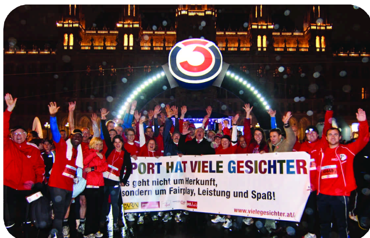
Beim Vienna Night Run, der alljährlich zugunsten von Licht-für-die Welt stattfindet

Im Sport geht es um Leistung, um Fairness und um Spaß und nicht darum, wo jemand geboren worden ist. Mit Rassismus, Menschenfeindlichkeit und Ausgrenzung machen rechte Verhetzer weder bei den Läufern noch bei ihren Fans Meter! Menschenfreundlichkeit, Aufgeschlossenheit und Begegnungen auf gleicher Augenhöhe sind auch beim Sport angesagt.