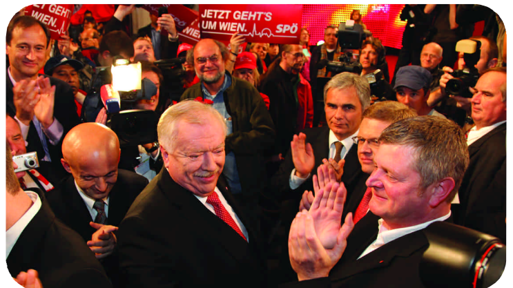
Unser Bürgermeister Dr. Michael Häupl wird im Wahlzelt am 10. Oktober umjubelt und zur Wiederwahl beglückwünscht

Die vielen Einsätze bei Verteilaktionen auf der Straße, die hunderten Gespräche mit euren