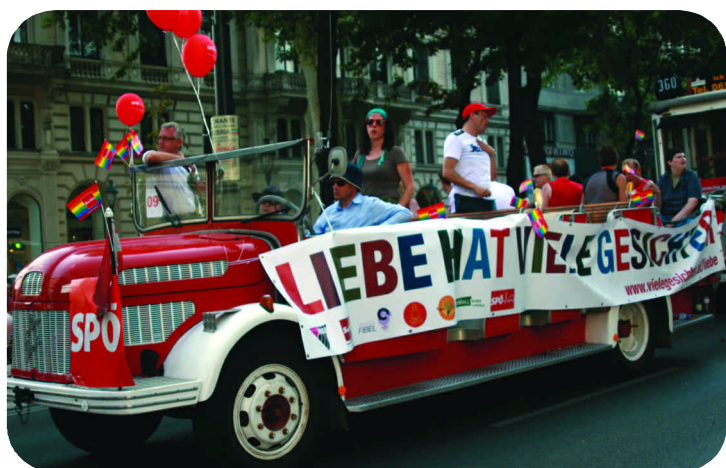
Auf der Regebogenparade war „Liebe hat viele Gesichter“ selbstverständlich auch vertreten